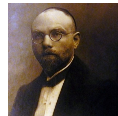
Jacob Israël de Haan

Onlangs hoorde ik tijdens een Pro-Palestinademonstratie de leus 'Zionism must fall' en ik voelde wel aan wat de demonstranten bedoelen: exclusivisme, superioriteit en racisme moeten stoppen. Want voor Palestijnen zijn dát de aspecten die zij van zionisme ervaren. Maar voor